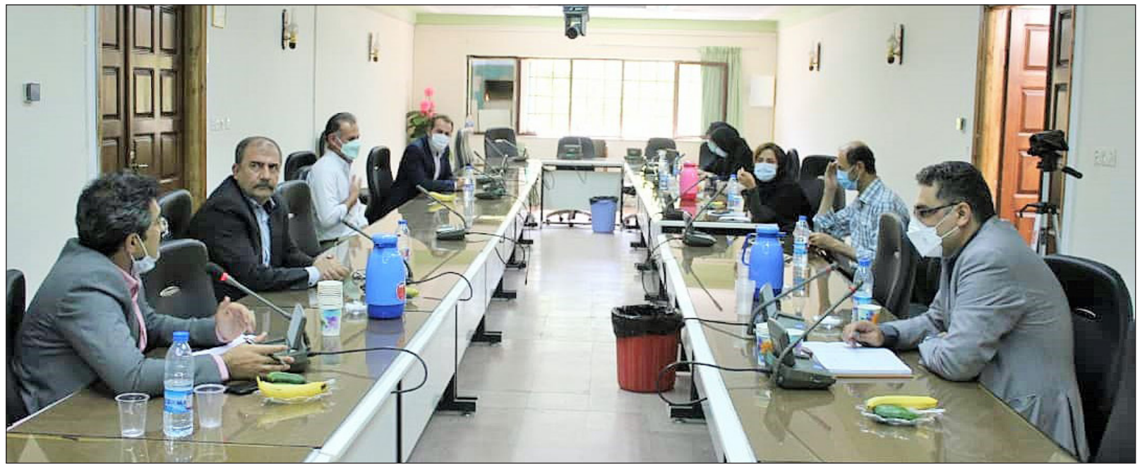
مرتبط ندیده ایم و هر روز شاهد فرار جوانان از روستا و کشاورزی هستیم. وی اعلام کرد: یکی از جوانان کردستانی در

معاون علمی و فناوری رئیس جمهور با تأکید بر ضرورت تغییر ساختارها و رویکردها گفت: دانشگاه به تنهایی نمی تواند نیروی مورد نیاز توسعه را تامین کند و باید تمام ارگان های دخیل